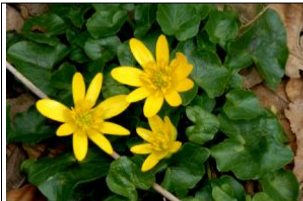
Plante en fleur