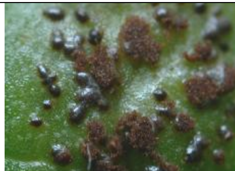
Sores à téleutospores, foliicoles, épiphyllées roux à brunâtre clair, compacts et nettement pulvérulents