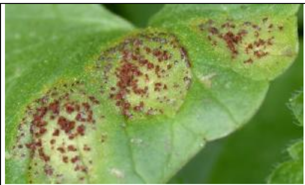
Taches sur les feuilles indiquant la présence de télies épiphyllées