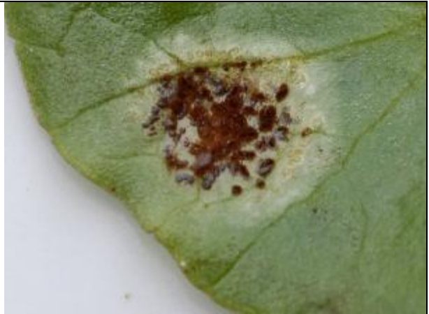
Sores à téléospores, hypophylles, roux à brunâtre clair, compacts et nettement pulvérulents