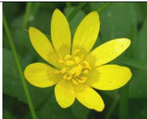
Détail de la fleur